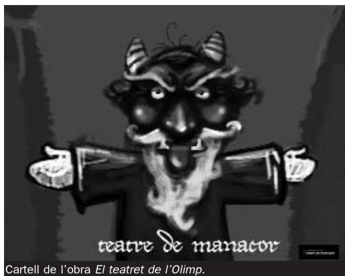
Cartell de l'obra El teatret de l'Olimp .