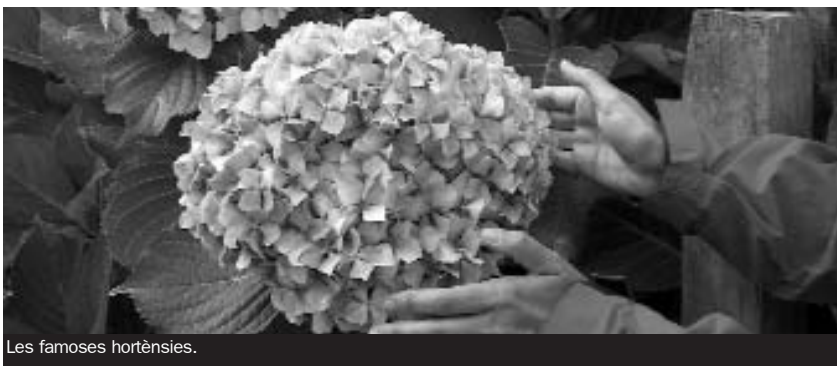
Les famoses hortènsies.