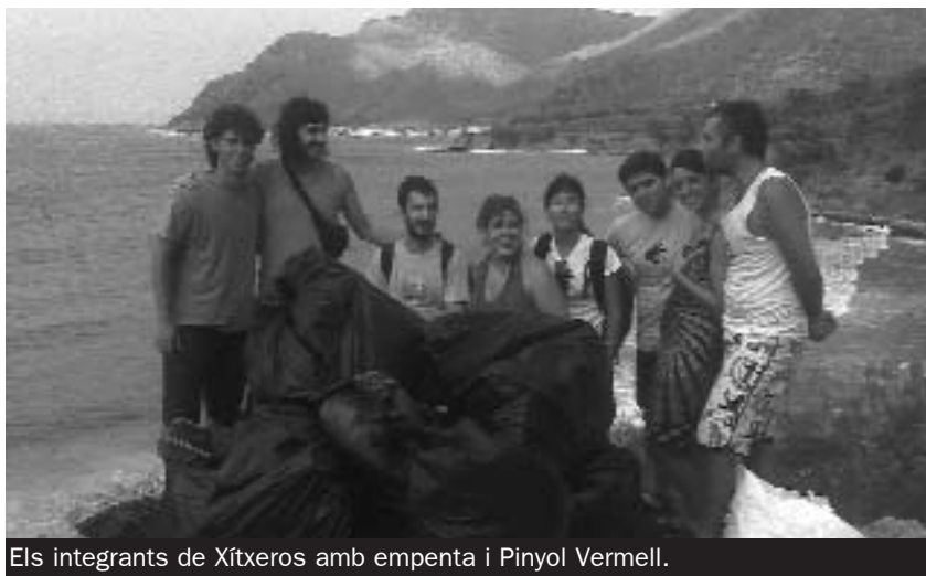
Els integrants de Xítxeros amb empenta i Pinyol Vermell.

recol·lecta de fems és el de fomentar el civisme a les nostres platges, tant als turistes com als mallorquins. Sense consciència ecològica, l'espai natural de les nostres illes no es podria conservar. I si no ho feim primer nosaltres, no ho faran els de fora. Cap de les dues entitats no descarta fer neta alguna altra platja en el que queda d'any.