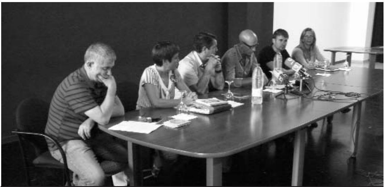
Representants de les institucions i responsables de la Fira presentaren aquesta XIV edició.