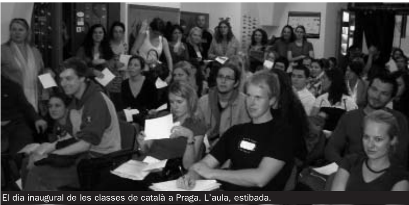
El dia inaugural de les classes de català a Praga. L'aula, estibada.