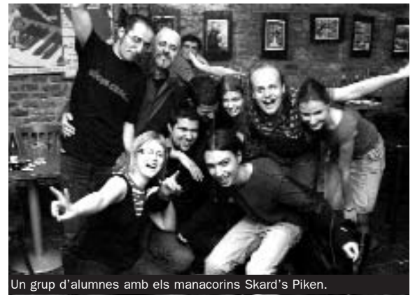
Un grup d'alumnes amb els manacorins Skard's Piken.