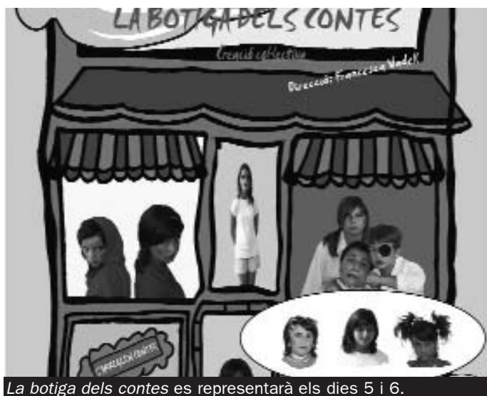
La botiga dels contes es representarà els dies 5 i 6.