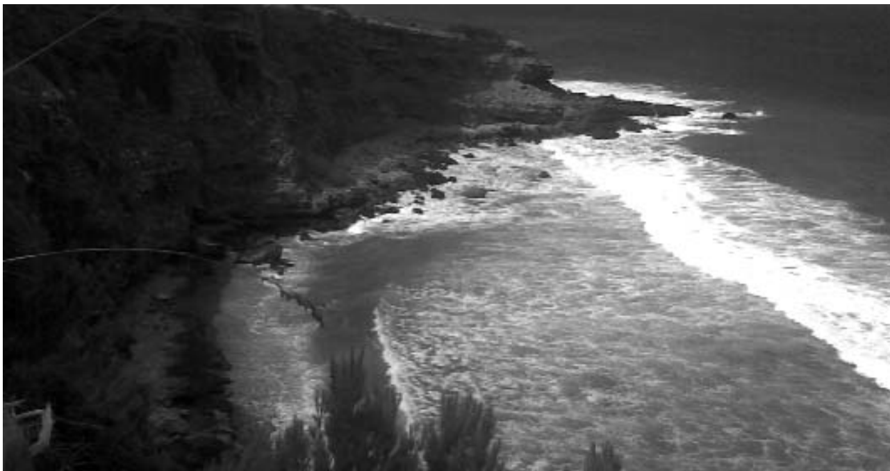
La costa de Betlem comprèn de na Clara i i el Caló d'es Corb Marí i pertany a la Reserva Marina de Llevant.