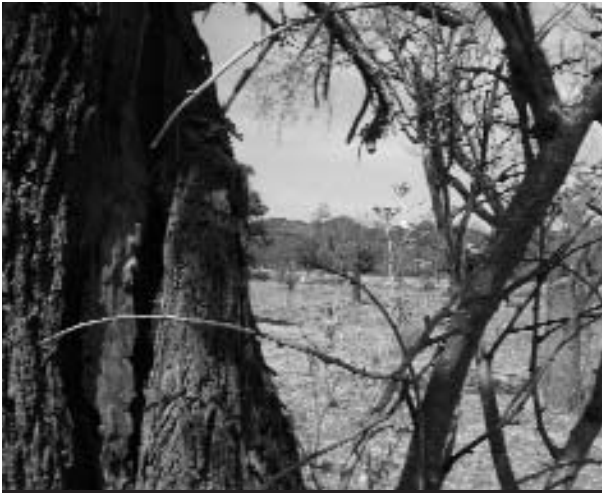
La malaltia entra a l'arbre per les ferides de la fusta.