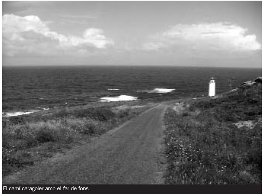
El camí caragoler amb el far de fons.

Un altre allotjament que ens va captivar va ser al Monte de Santa Tegra, on el riu Miño fa frontera natural amb Portugal i per un preu més que