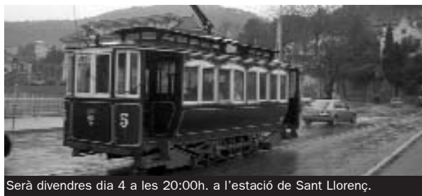
Serà divendres dia 4 a les 20:00h. a l'estació de Sant Llorenç.