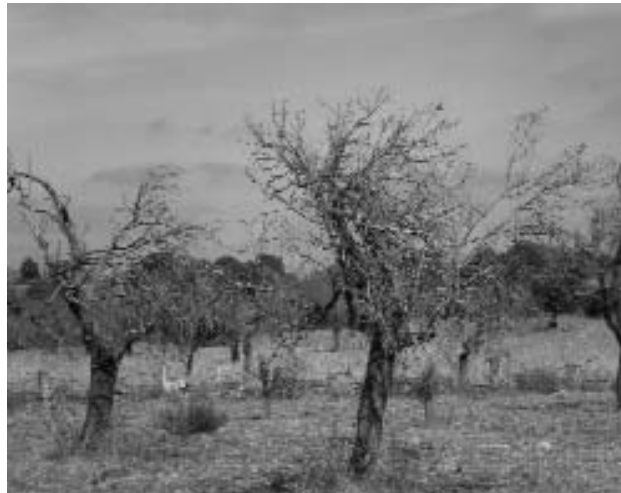
Es recomana netejar bé les eines per evitar el contagi.

fusta. Primer de tot, penetra a la llenya pels teixits vasculars de les ferides i seguidament afecta tot el tronc fins arribar a les fulles de l'arbre.