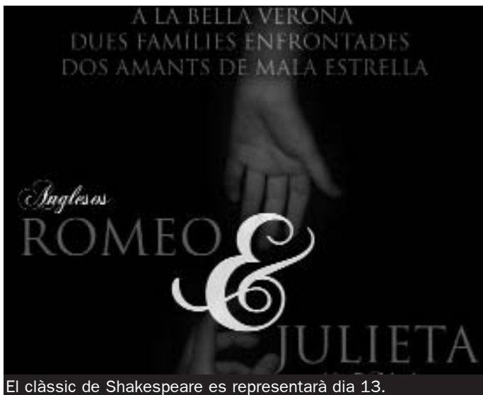
El clàssic de Shakespeare es representarà dia 13.