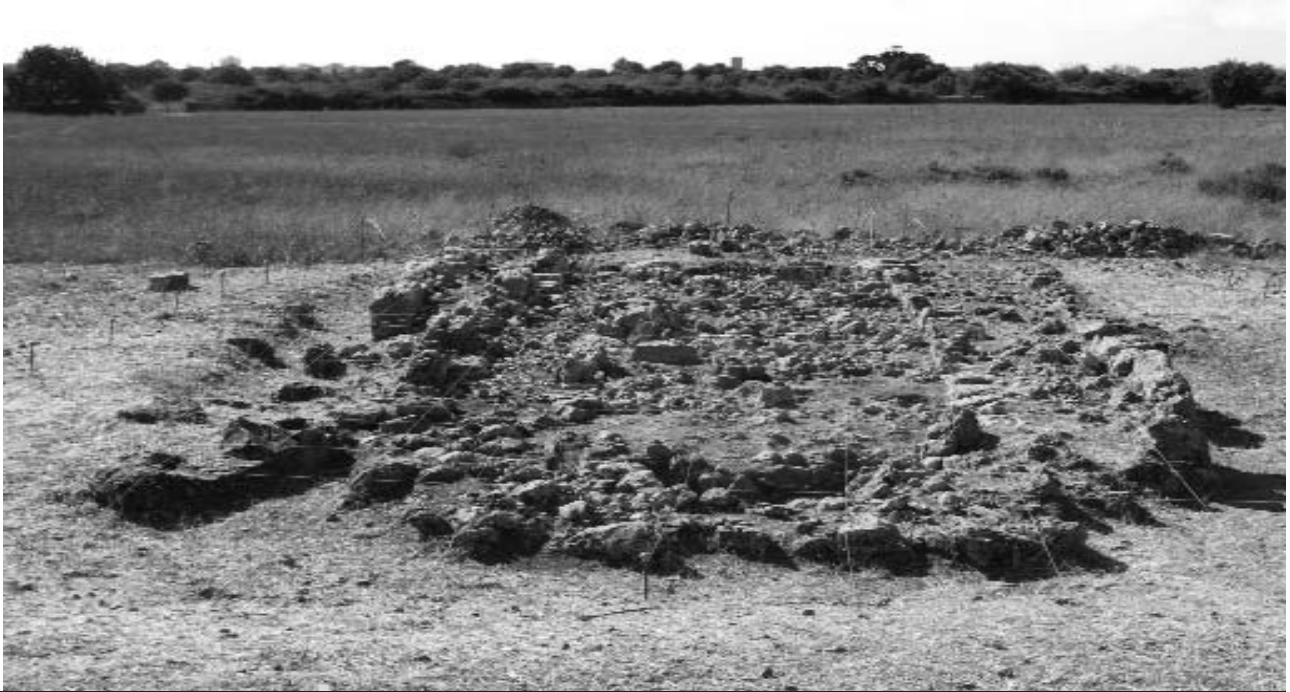
Vista des de l'absis de la naveta que s'està excavant en aquesta vuitena campanya.