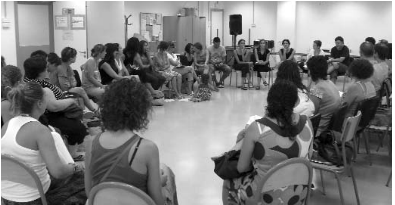
Moment de la cloenda de l'Escola d'Estiu d'Ensenyants d'enguany.