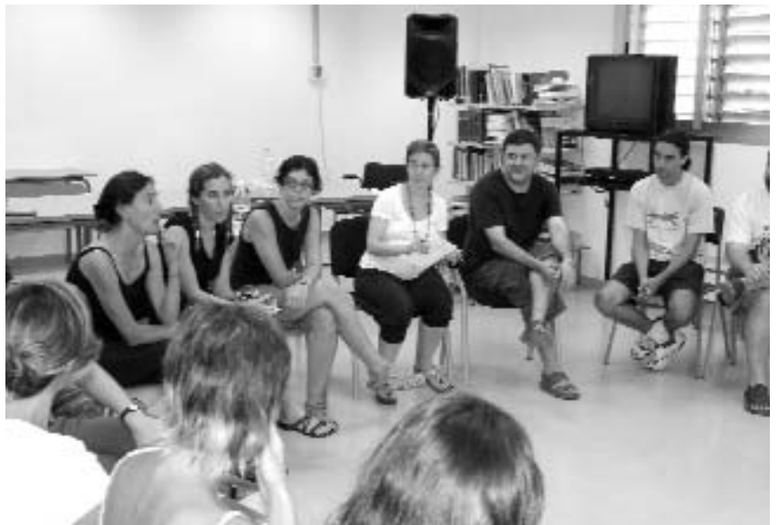
Part del secretariat del Moviment per a la Renovació Pedagògica.

És el primer any que l'Escola d'Estiu d'Ensenyants dedica tots els seus cursos a un únic tema, i és que “la creativitat és importantíssima per a l'educació, i allò que hem volgut fer ha estat donar recursos als mestres