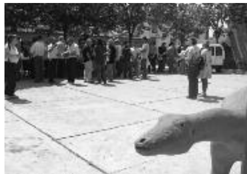
L'aperitiu davant l'ajuntament de Coll de Nargó

Ja és hora que puguem fer-nos saber de forma periòdica les activitats que duem a terme perquè cada entitat les pugui difondre dins del seu entorn, i també per col·laborar en projectes conjunts si hi ha aquesta possibilitat. El petit, però proper, País dels Pirineus donarà suport a les activitats paleontològiques, almenys des de la SAC, i el Consorci Paleontologia i Entorn posarà a l'abast dels ciutadans d'Andorra aquest ric patrimoni de nius, petjades i ossos que ens farà gaudir a grans i petits. Obrim una porta al futur des de milers d'anys ençà.