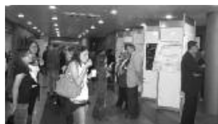
Estudiants revisant els posters científics