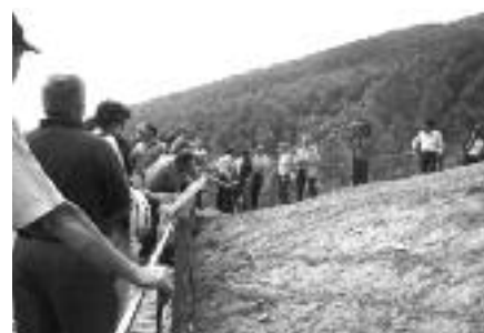
El Mirador del Cretaci