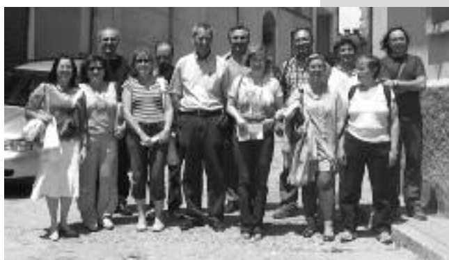
L'expedició de la SAC després de la visita al museu

El proper dissabte 28 de febrer es durà a terme la inauguració de l'ampliació del museu dels Dinosauris Límit KT de Coll de Nargó i del muntatge d'escultures al Mirador del Cretaci finançat a través de la Fundació Territori i Paisatge i amb aportacions de material proporcionades per la família andorrana Duró Vidal i la SAC. L'acte s'iniciarà a les 10 h del matí a l'ajuntament de Coll de Nargó, esmorzar a les 10,30, inauguració de l'ampliació del museu a les 11, i a les 12 del migdia visita al Mirador del Cretaci.