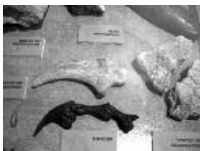
Peces del museu Límit KT